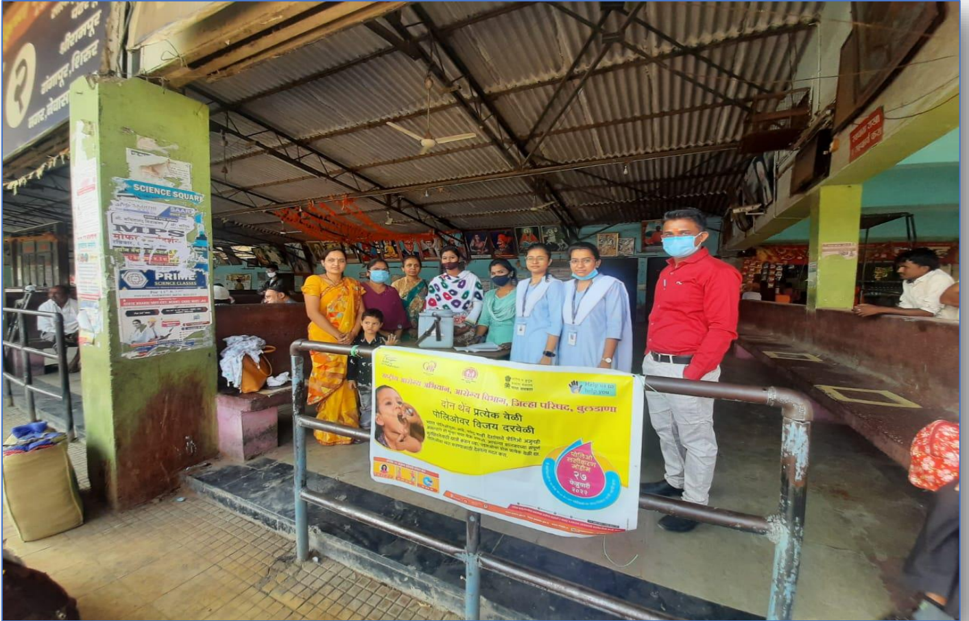
Pulse Polio Campaign