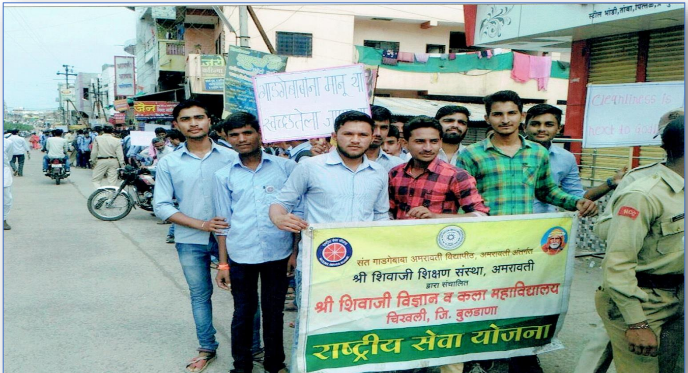
Rally on Cleanliness Campaign