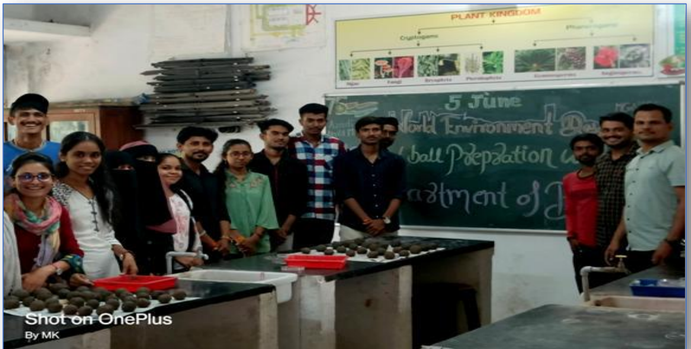
Seed Ball Preparation