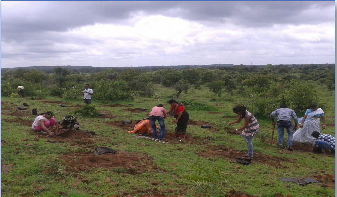
Tree Plantation at Ancharwadi