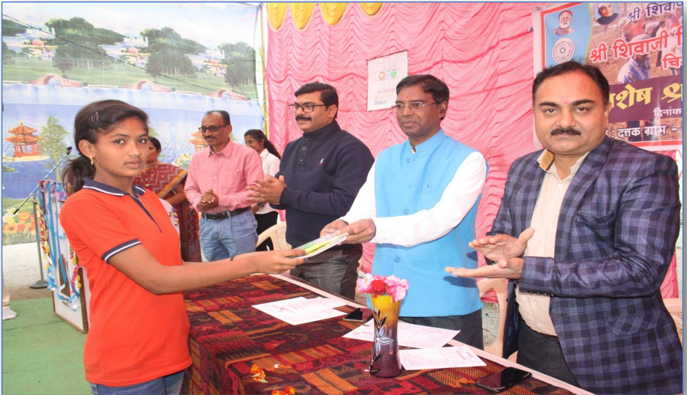
Free Note Book Distribution to the ZP School Students