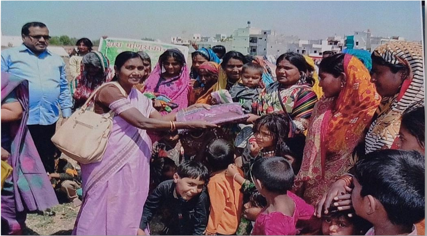
Distribution of Sarees to Poor Women