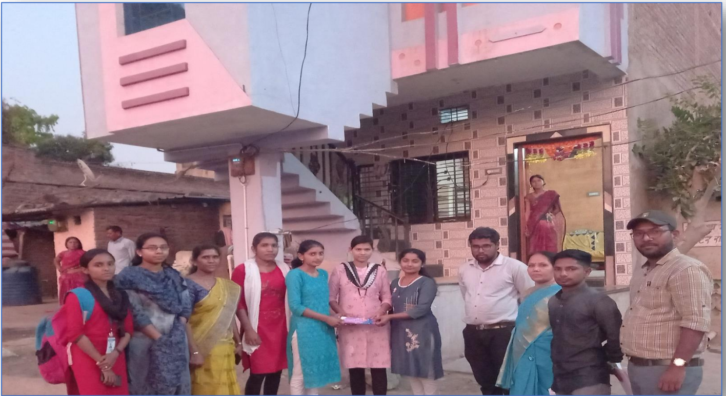
Free Distribution of Sanitary Napkin