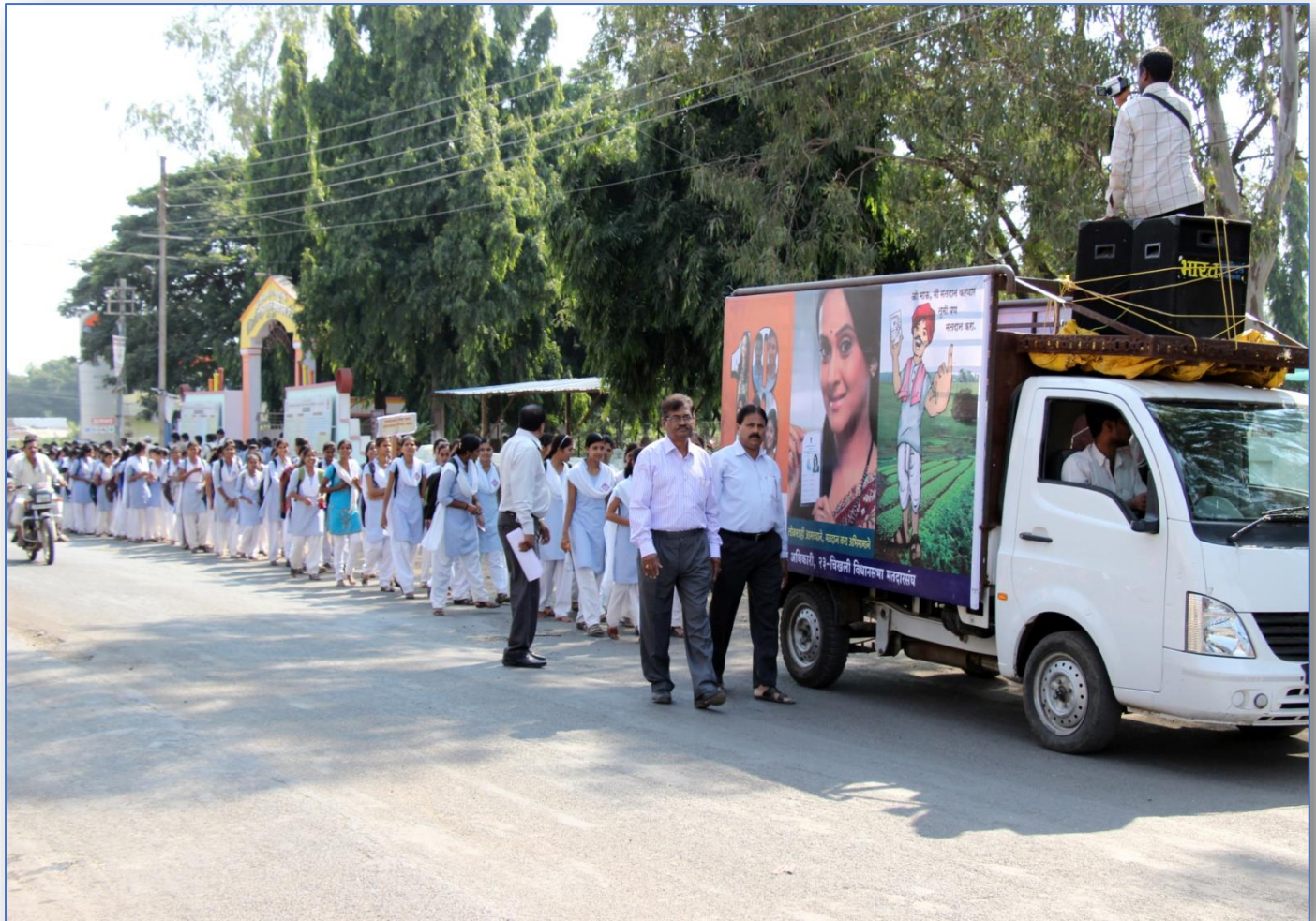
Rally on Water Conservation