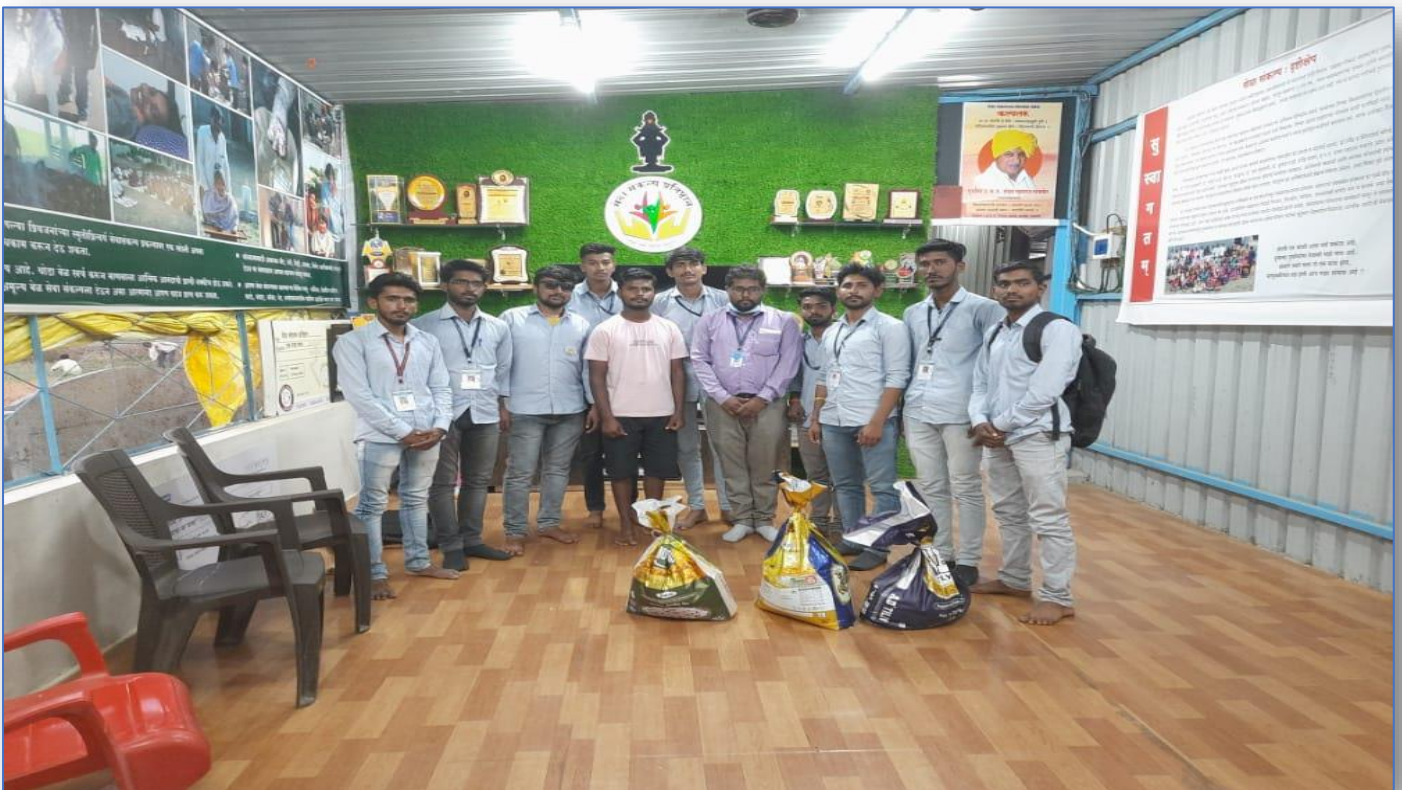
Distribution of Food Grains to Seva Sankalp Ashram