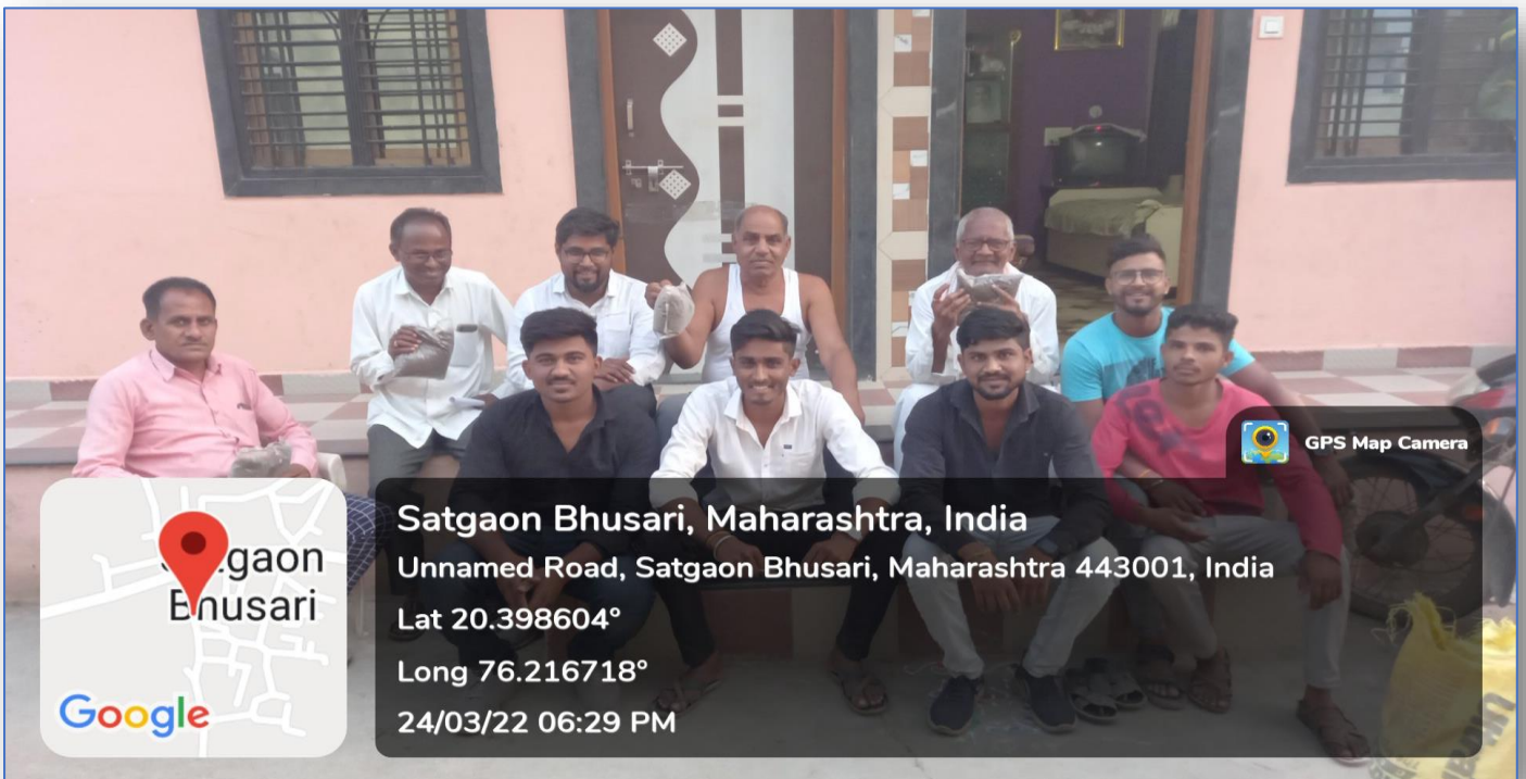
Distribution of Vermicompost to Farmers