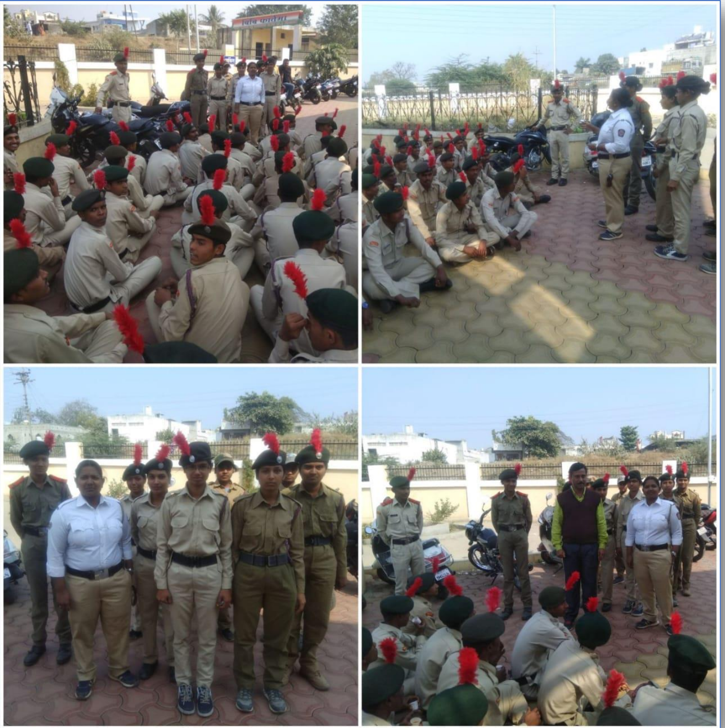
Road Safety Week