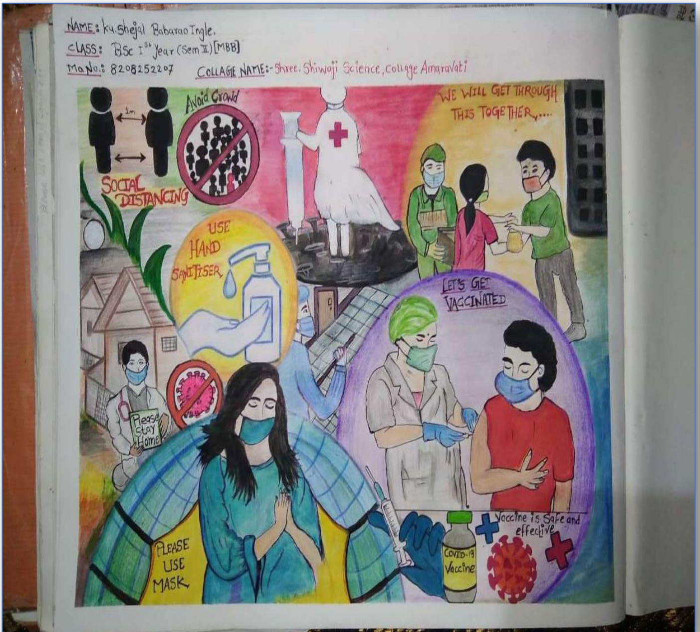
E – Poster Competition on Covid – 19 awareness