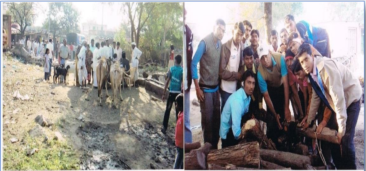
Use of Radium Sticker to Bullock cart & Oxes