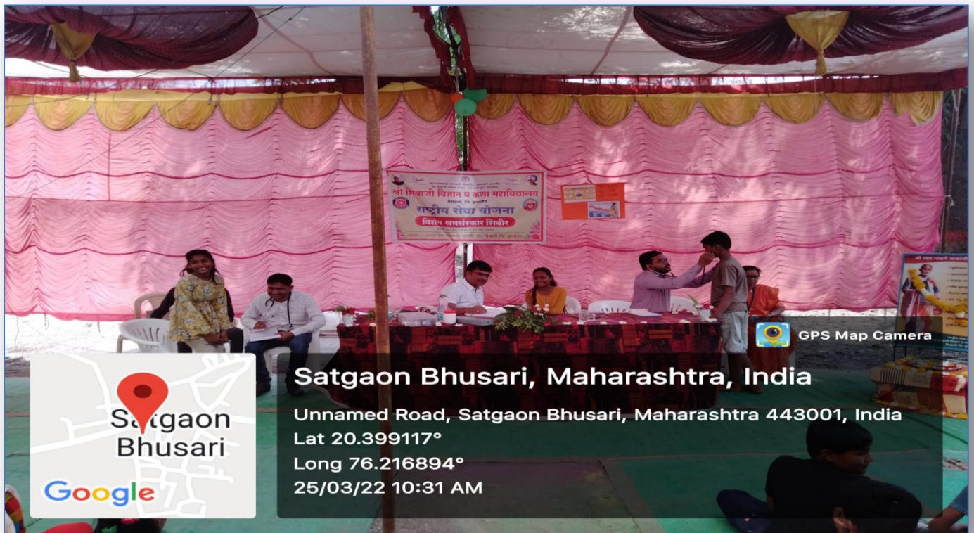
Health Checkup (Dental, Pediatric & Ophthalmic)