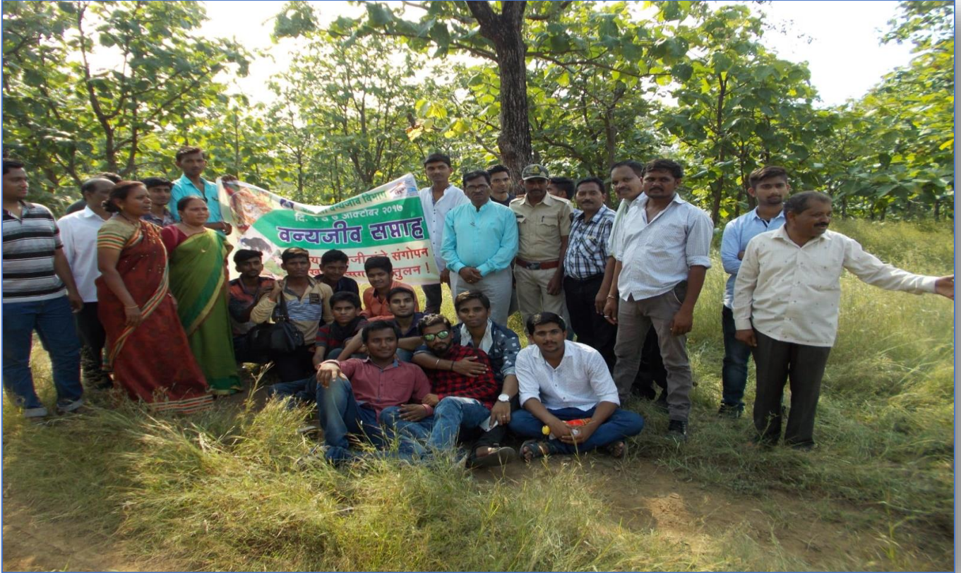
Forest Walk at Dnyanganga Sanctuary