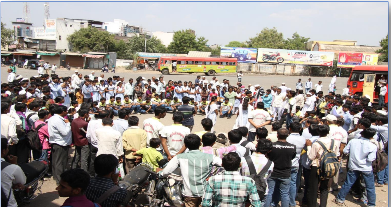
Voter Awareness Street Play at Bus Stand Chikhli