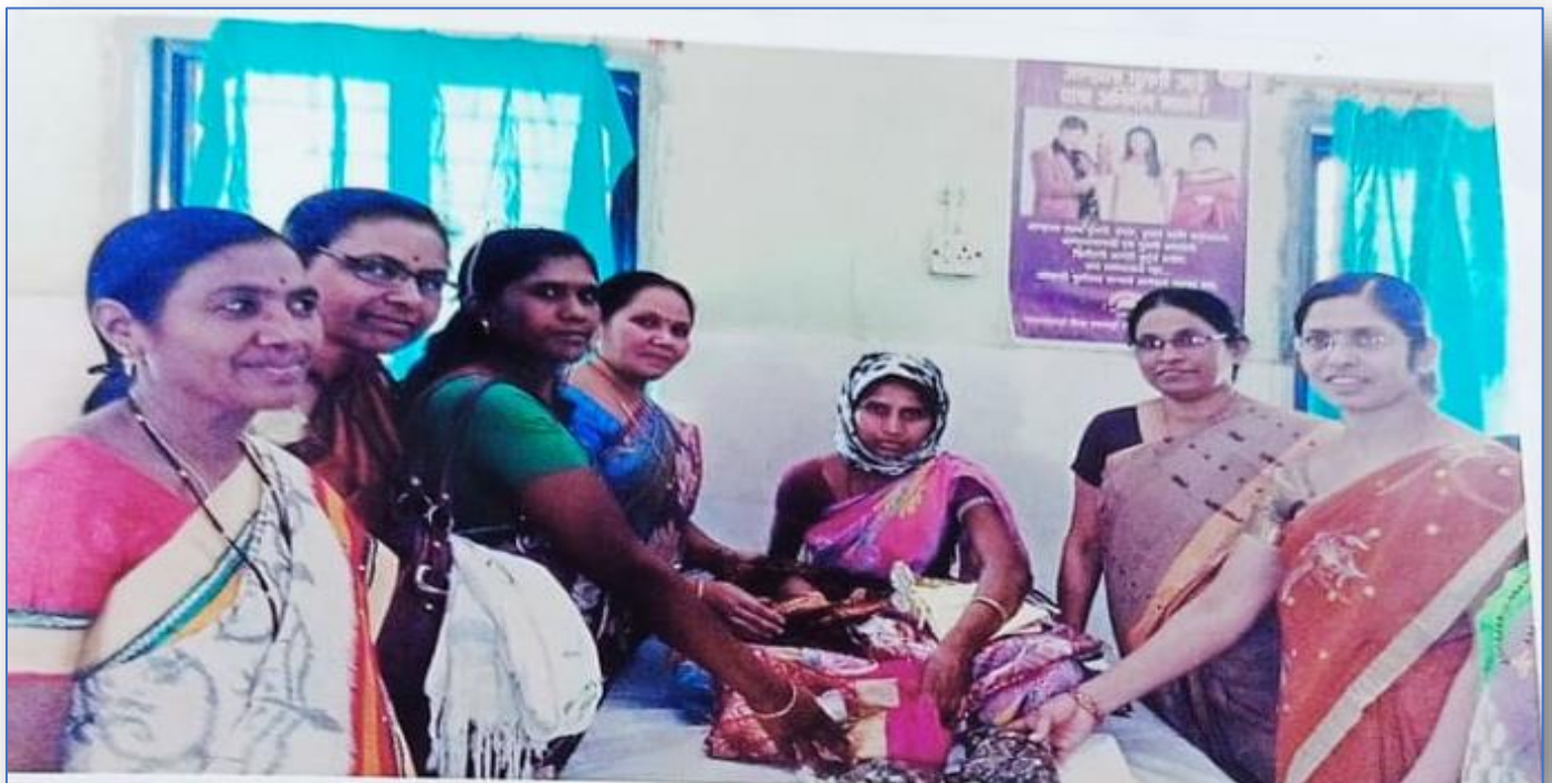
Felicitation of Birth of Girl Child at rural Hospital