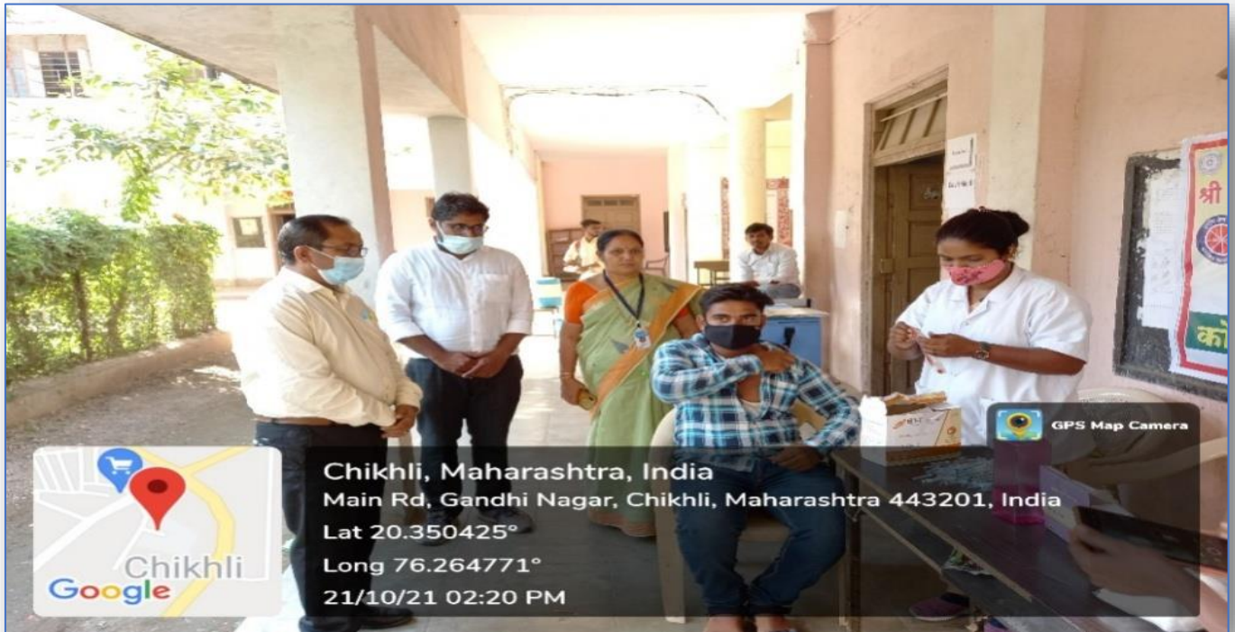
COVID-19 VACCINATION CAMP