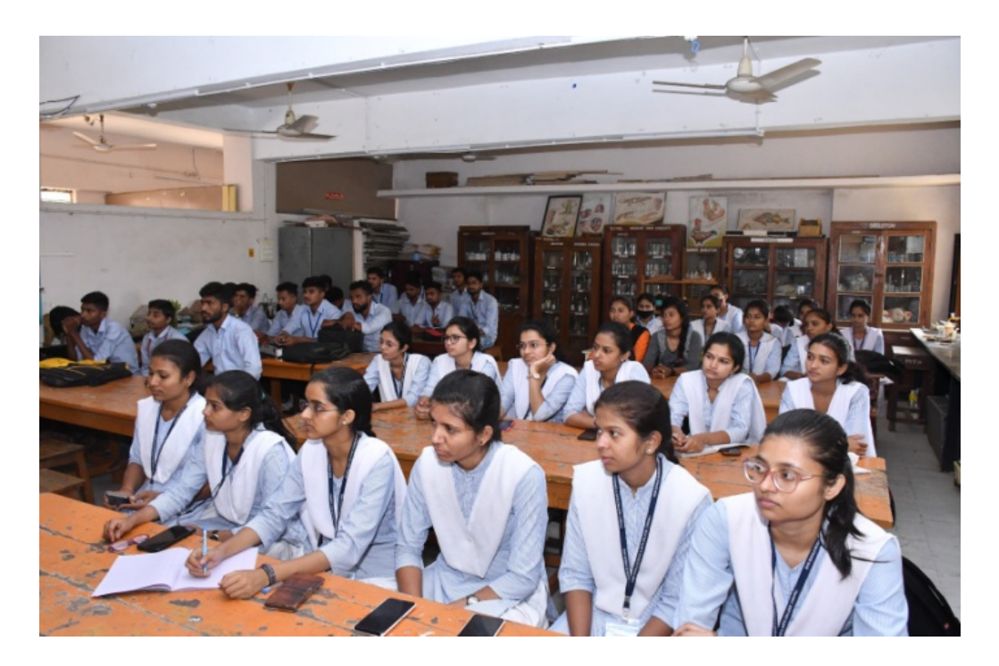
Student Participants for workshop