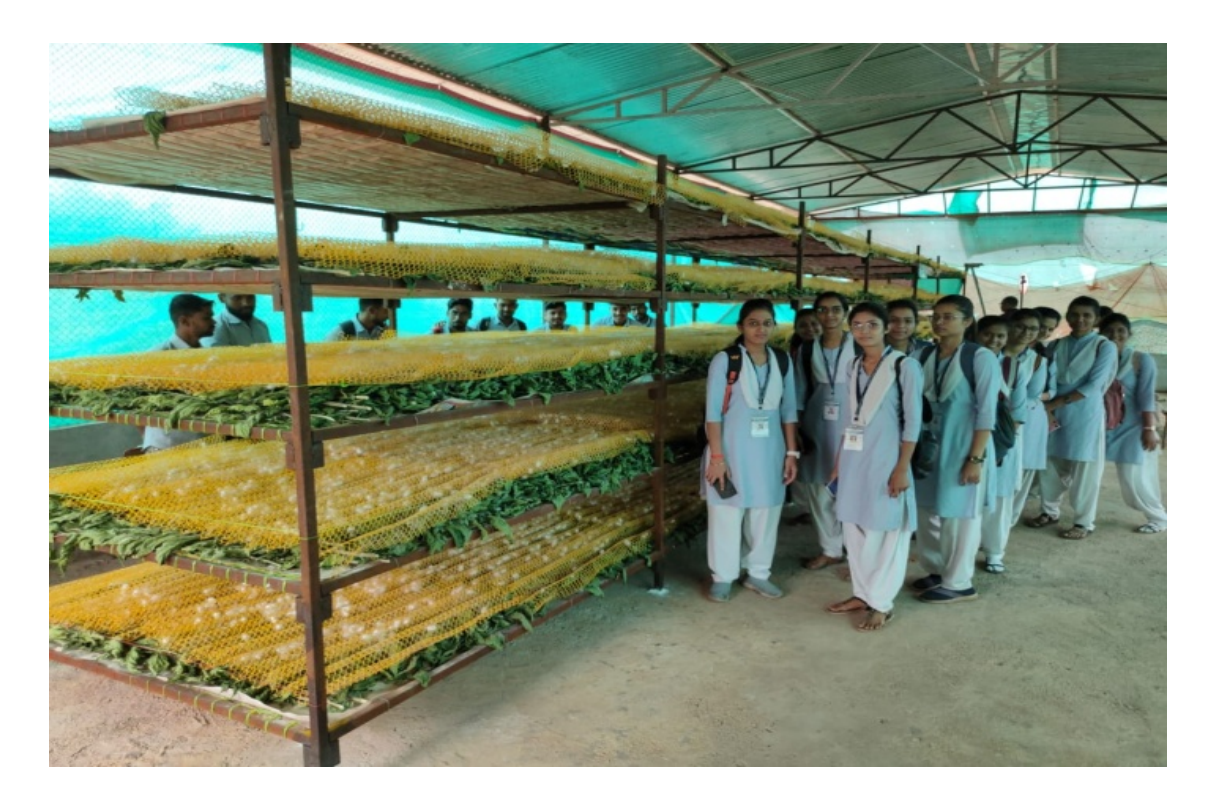
Sericulture Project Study: at cocoon stage of silkworm