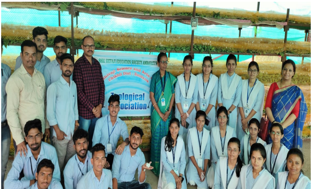
Sericulture Project Visit