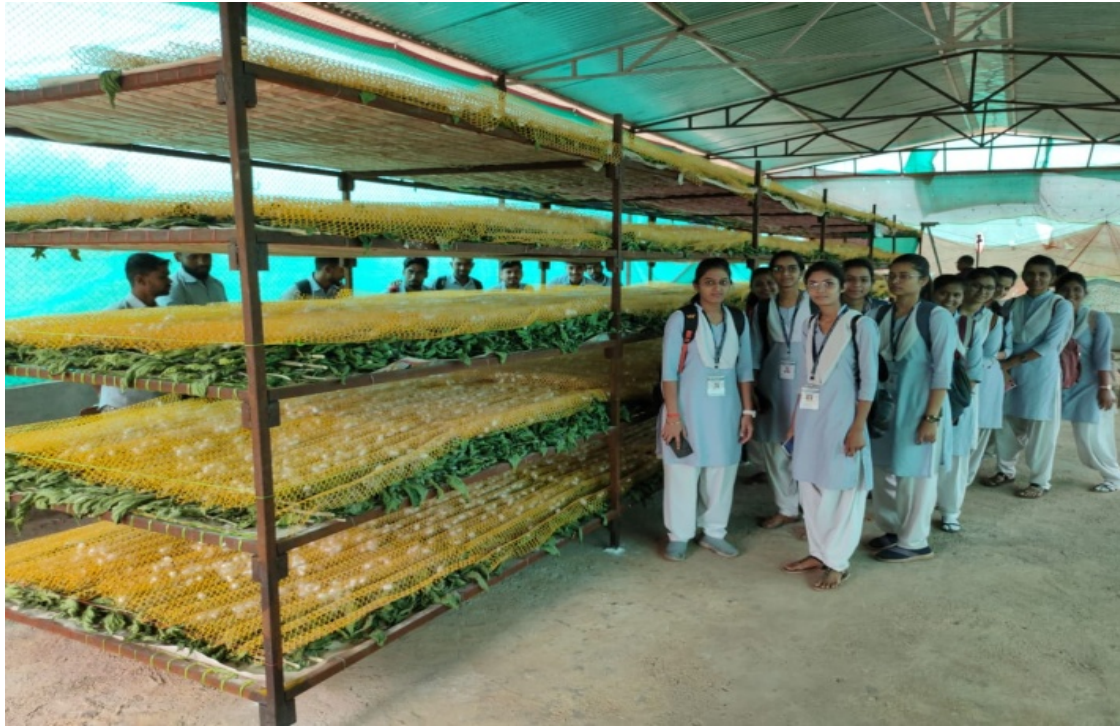
Sericulture Project Study: at cocoon stage of silkworm