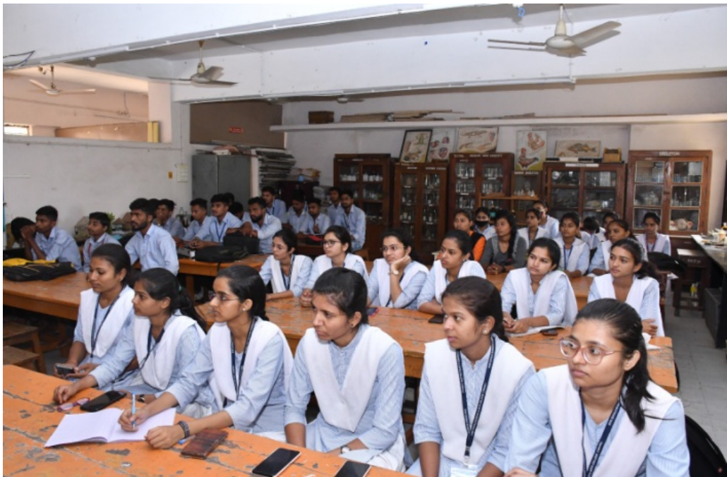
Student Participants for workshop