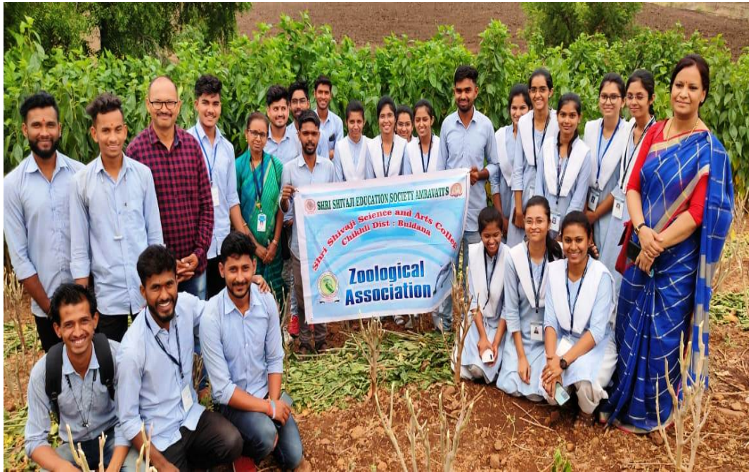
Field visit: Mulberry Garden