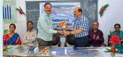
चिखली : कार्यक्रमात उपस्थित मान्यवर.