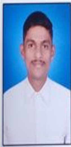
CDT SAURASH SONALKR Sashestre Sims Bel