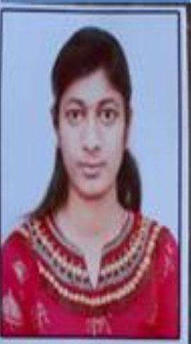
CDT PRAGATI HADE MAHARASHTRA FOREST GUARD