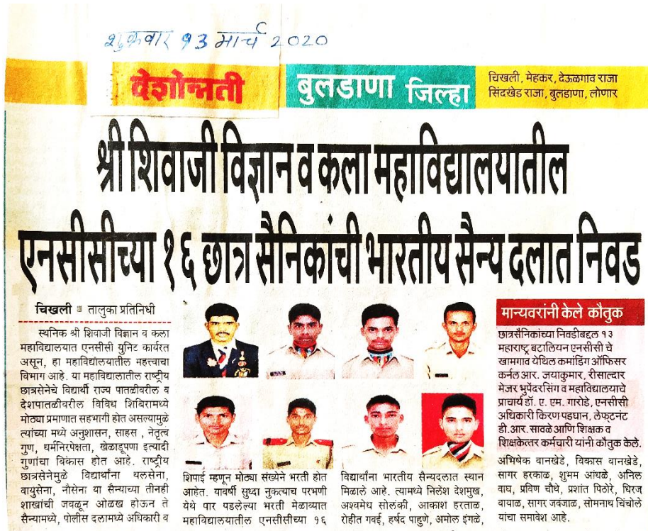
Selection Of 16 NCC Cadets in Indian Army

Upatthi Coordinator IQAC, Shri Shivaji Sci. & Arts College, Chikhli Dist. Buldana