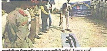
एनसीसीच्या विद्यार्थ्यांना राख हताळणीची माहिती देण्यात आली.