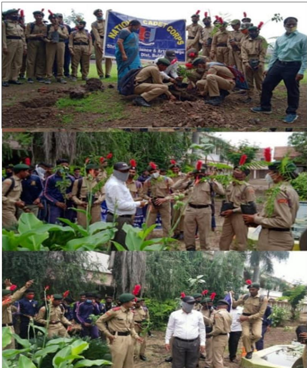
Tree Plantation 2020-21