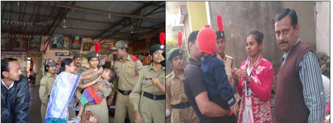
Participation of Girl NCC Cadets in Pulse Polio Drive