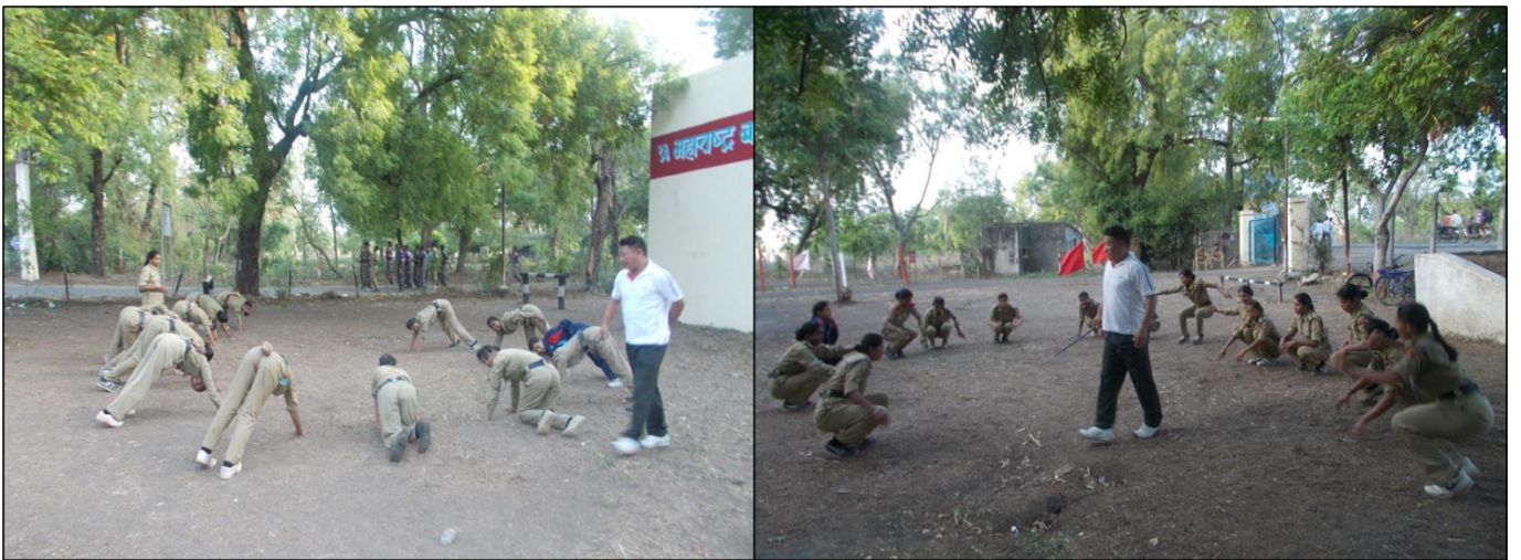
Participation of Girl NCC Cadets in Annual Training Camp