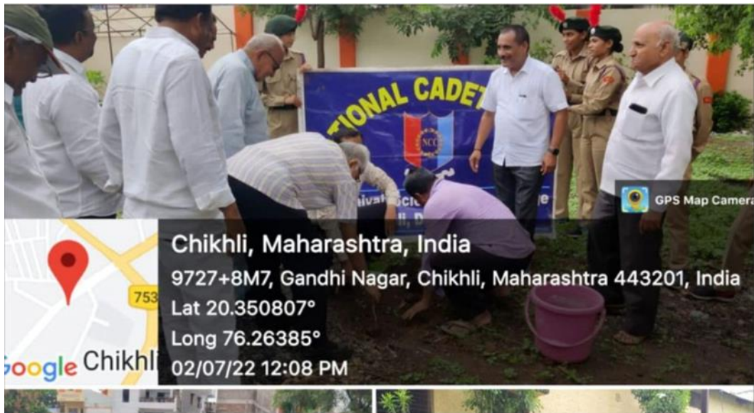
Tree Plantation 2021-22