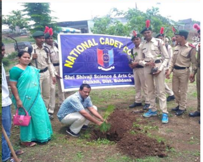
Tree Plantation 2018-19