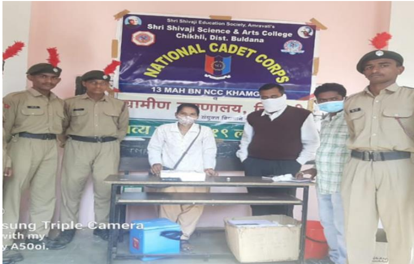
Covid-19 Vaccination (2021-22)