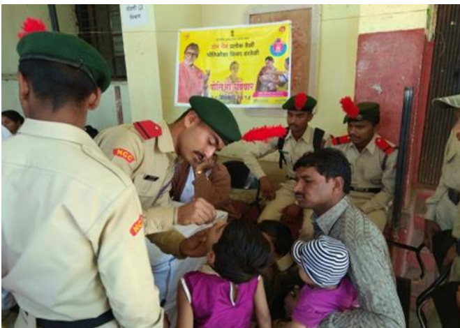
Pulse Polio Drive:2018-19