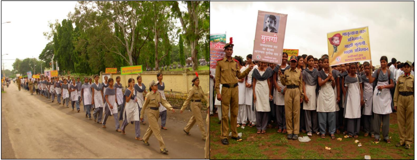
Participation of Girl NCC Cadets in Save Girl Child Movement