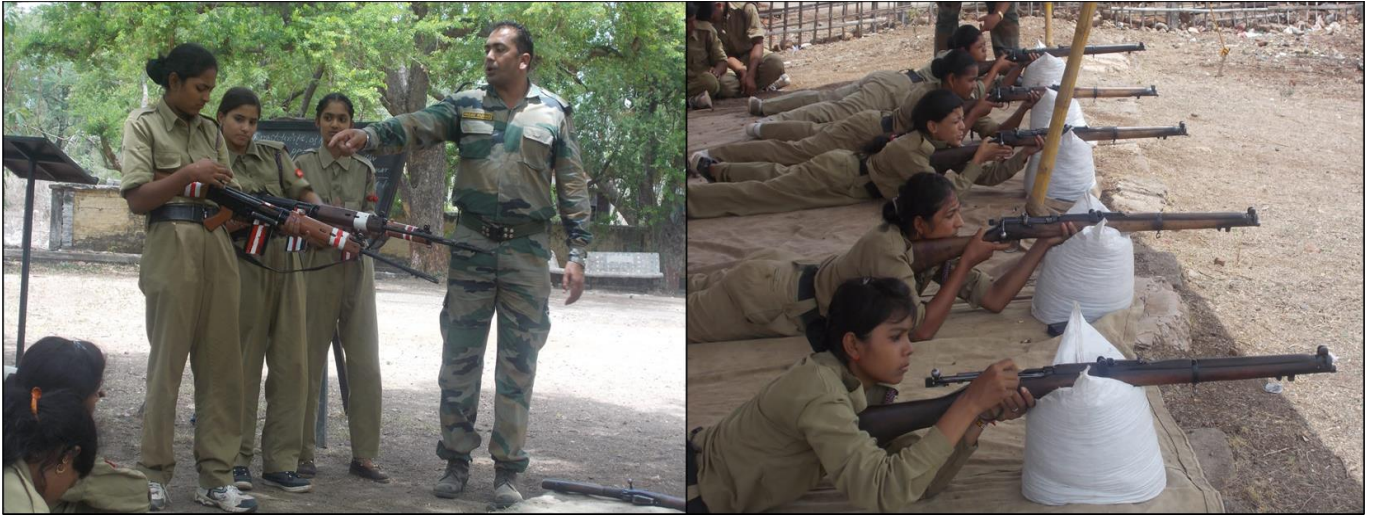
Participation of Girl NCC Cadets in Annual Training Camp