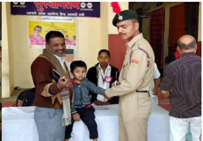
Pulse Polio Drive:2017-18