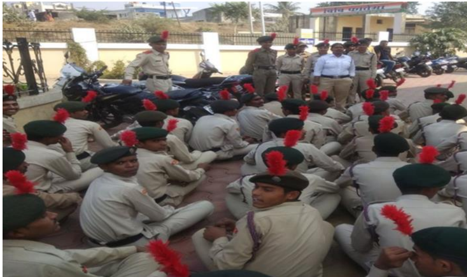
Road Safety Week (2017-18)