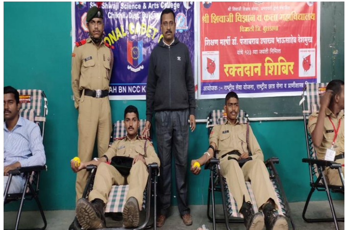
Blood Donation: 2020-21