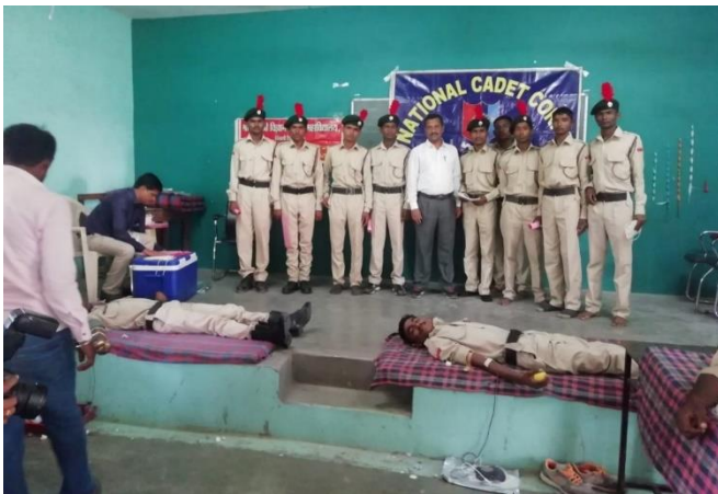
Blood Donation: 2018-19