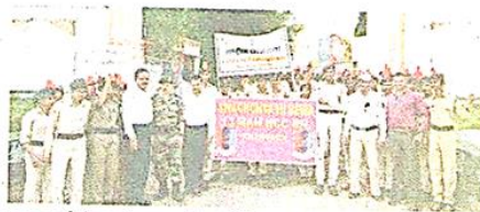
स्वच्छता ही सेवा अभियानास शिवाजी विद्यालयातून प्रारंभ करण्यात आला.