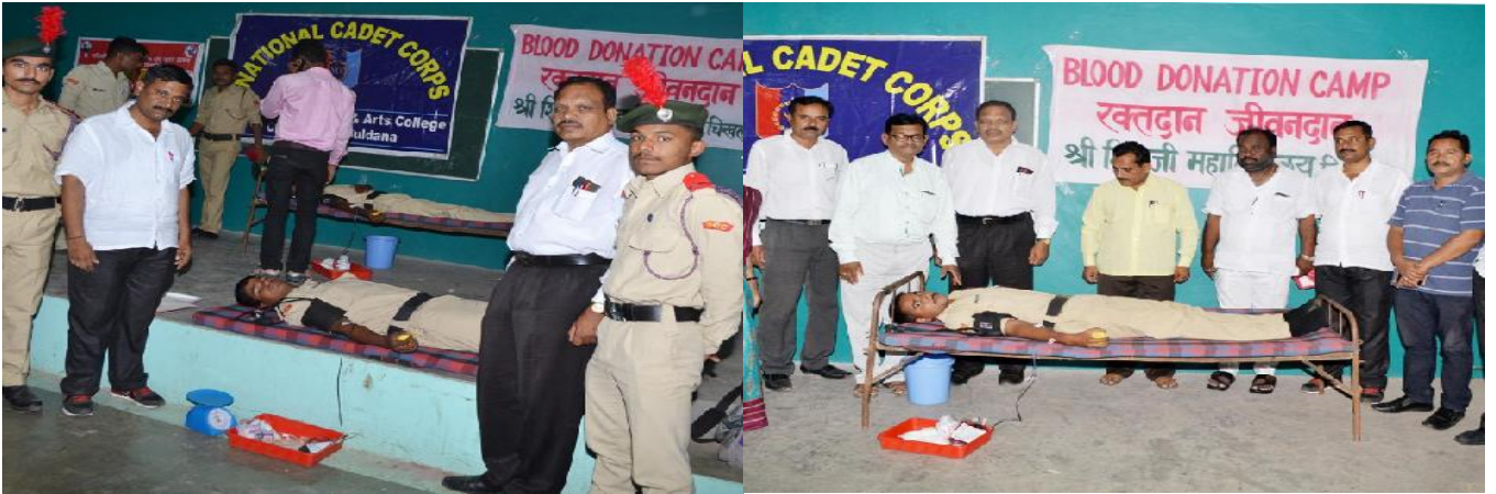
Blood Donation: 2017-18