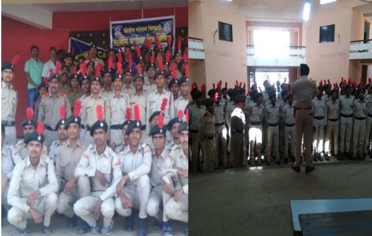
Road Safety Week (2018-19)