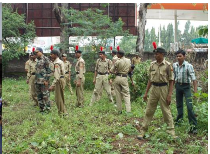
Tree Plantation 2017-18