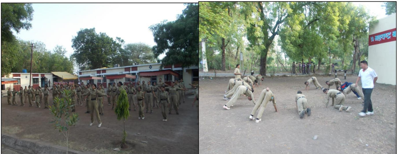
Participation of Girl NCC Cadets in Annual Training Camp